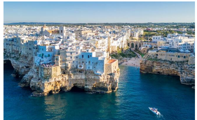
Polignano a Mare